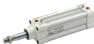
ISO 15552 cilinder type HCR, hoge corrosiebestendigheid, diameters 32 tot 125mm

ISO 6432 stainless steel cylinders, diameters from 16 to 25 mm