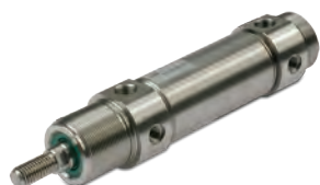
Roestvaststalen rondcilinder, diameters 32 tot 63mm

Pressure regulators for drinking water, BIT Series F, 1/8" and 1/4" connections