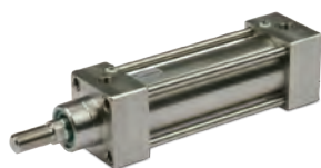
ISO 15552 roestvaststaal cilinder, diameters 32 tot 125mm

ISO 15552 cylinders Series HCR, High Corrosion Resistance, diameters from 32 to 125 mm