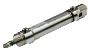
ISO 6432 roestvaststaal cilinder, diameters 16 tot 25mm

ISO 6432 stainless steel cylinders, diameters from 16 to 25 mm