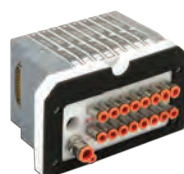
Ventieleiland voor spatwater omgeving. Serie HDM, 4 tot 16 ventielspoelen

Round stainless steel cylinders, diameters from 32 to 63 mm